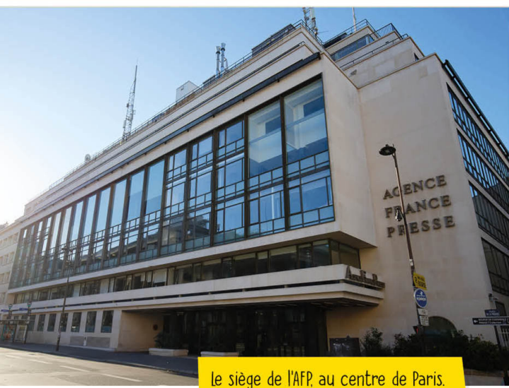
Le siège de l'AFP, au centre de Paris.

Des médias du monde entier. Chacun choisit les informations qui l'intéressent, parmi toutes les dépêches que nous envoyons, en fonction de ses choix rédactionnels (en presse, radio ou télé, on parle de ligne éditoriale) et des centres d'intérêt de son public.